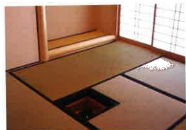
窮屈でもなく、豪華に飾り立てる必要もなく、亭主と客のほどよい距離感を保てるという広さ