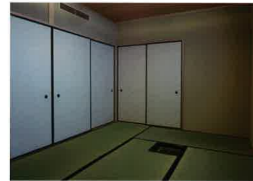
襖2枚が 締まった状態

天井内に納めたエアコンや、庭に面した明るい水屋、大きさ・位置に配慮した障子のデザインで、落ち着いた雰囲気を使い勝手のよい茶室が完成した。