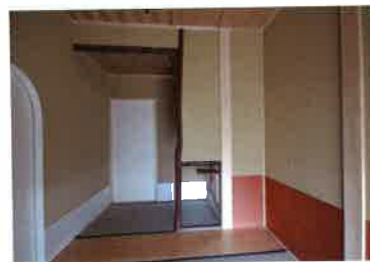
壁の剥落防止と、衣服と壁の両方を保護するために、腰の部分に美濃紙などの和紙を貼ること