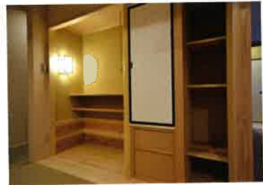
お点前（茶をたてる所作）に必要な茶道具を整える場所