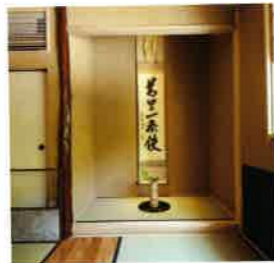
掛け軸などの掛物や花入れを飾る。亭主の好みで広さや形式が異なることも