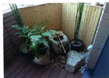
茶室に入る前に、客が手を清めるためにおかれた背の低い手水鉢に、まわりに役石（やくせき）をおいたもの