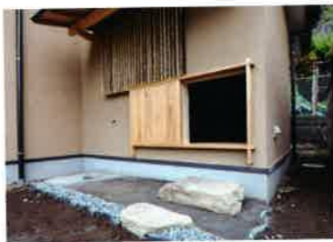
茶室への客の出入り口。一人人がにじってようやく入れる小さな入り口