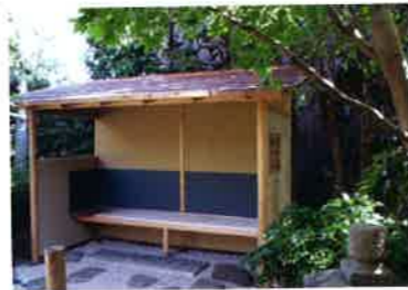
茶事のために、露地など茶席の外で客が亭主の迎付（むかえつけ）や席入の合図を待つための場所