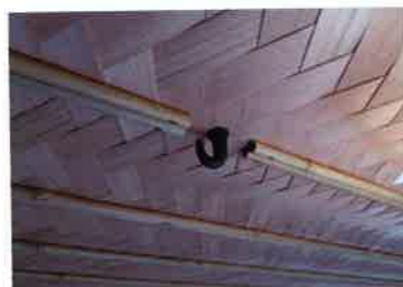
花入れや掛物、釜を吊るするための釘